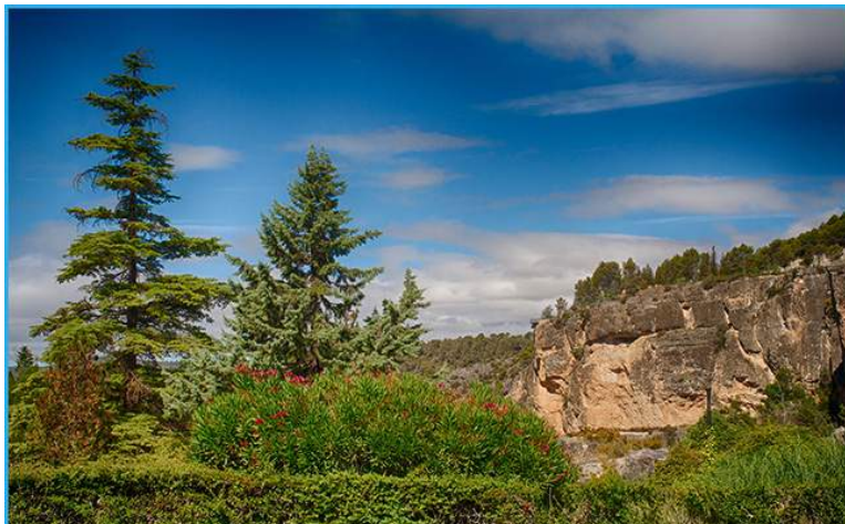
El entorno natural del embalse invita a pasear y disfrutar de la naturaleza

Por la ribera del embalse se van situando diferentes pueblos de la Alcarria Baja , provincia de Guadalajara: allí es donde se ubica el embalse, a poco más de 110 km. de