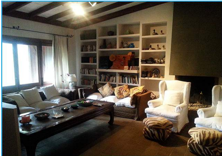
El salón con sus preciosas vigas vista

Destacamos sus agradables porches y su bonito y amplio jardín , poblado con numerosos olivos que dan color a la finca, que además cuenta con piscina.