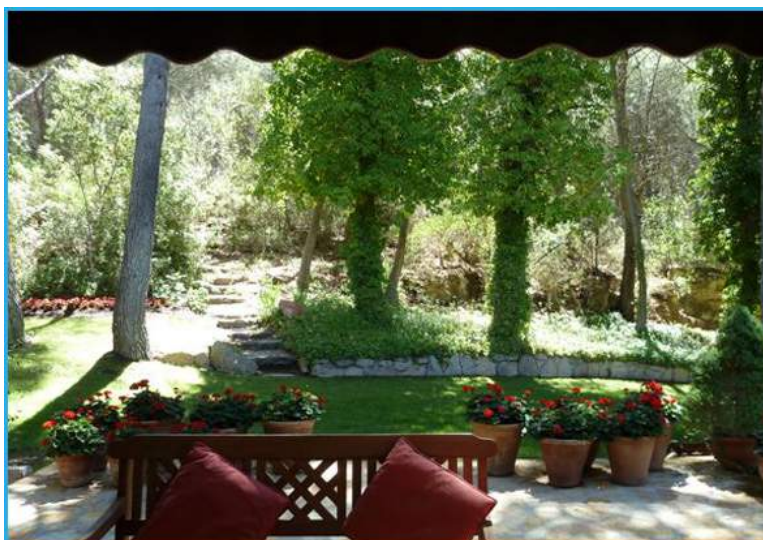
Éste es el magnífico entorno de una de sus terrazas

Sin duda, una gran oportunidad para disponer de una residencia en un lugar muy especial.