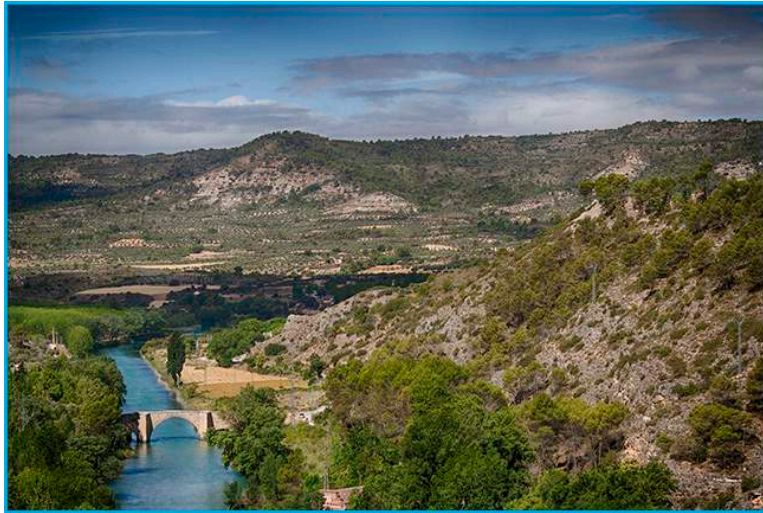
El espectacular paisaje natural del Embalse de Entrepeñas