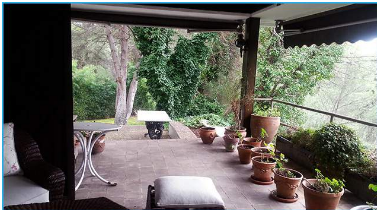
Los porches de la casa permiten unas bonitas vistas al jardín

Destacamos sus agradables porches y su bonito y amplio jardín , poblado con numerosos olivos que dan color a la finca, que además cuenta con piscina.