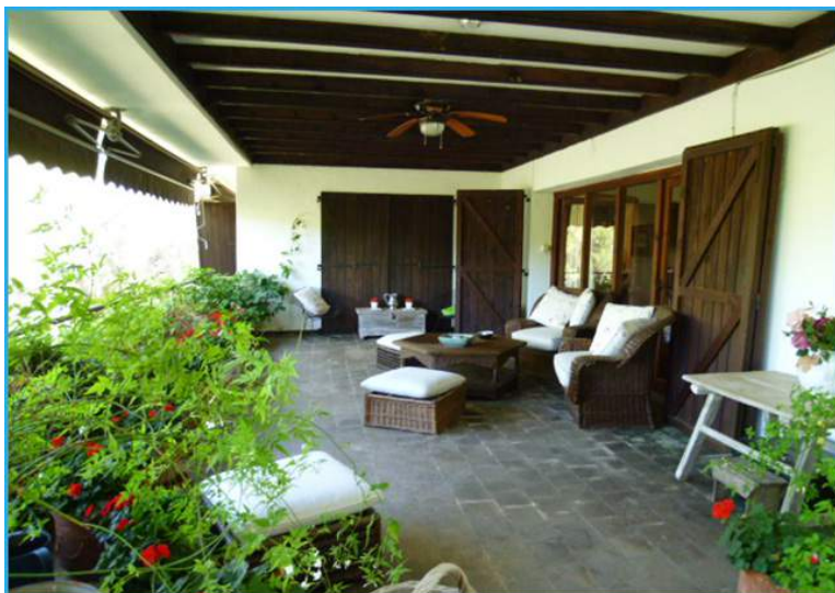
Una de las terrazas del inmueble

En la Urbanización de Peñalagos , al borde del pantano, se sitúa esta majestuosa casa diseñada por Rafael de la Joya, un destacado arquitecto que realizó importantes proyectos en la ciudad de Madrid, como edificios, conjuntos industriales, escuelas, fábricas o colegios.