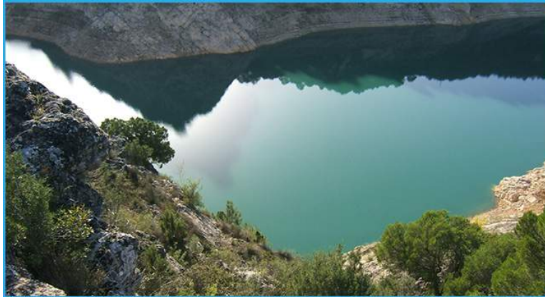
La profundidad de sus aguas permite practicar actividades deportivas en el embalse

Madrid. Junto a otros embalses de la zona forma lo que se conoce como el Mar de Castilla , un lugar óptimo para realizar actividades deportivas acuáticas . Esto es posible ya que el embalse de Entrepeñas es muy profundo y permite ser navegado.