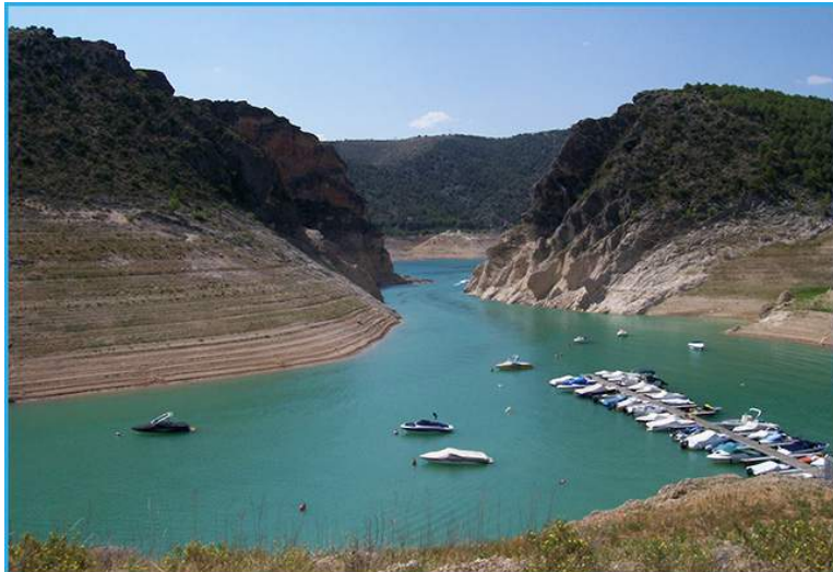
La Boca del Infierno , un precioso desfiladero del Embalse de Entrepeñas

El intenso color azul de las aguas del Tajo y lo apacible que resulta recrearse con las barquitas que se mecen en ellas hacen que el entorno del embalse de Entrepeñas recuerde al de una idílica postal .